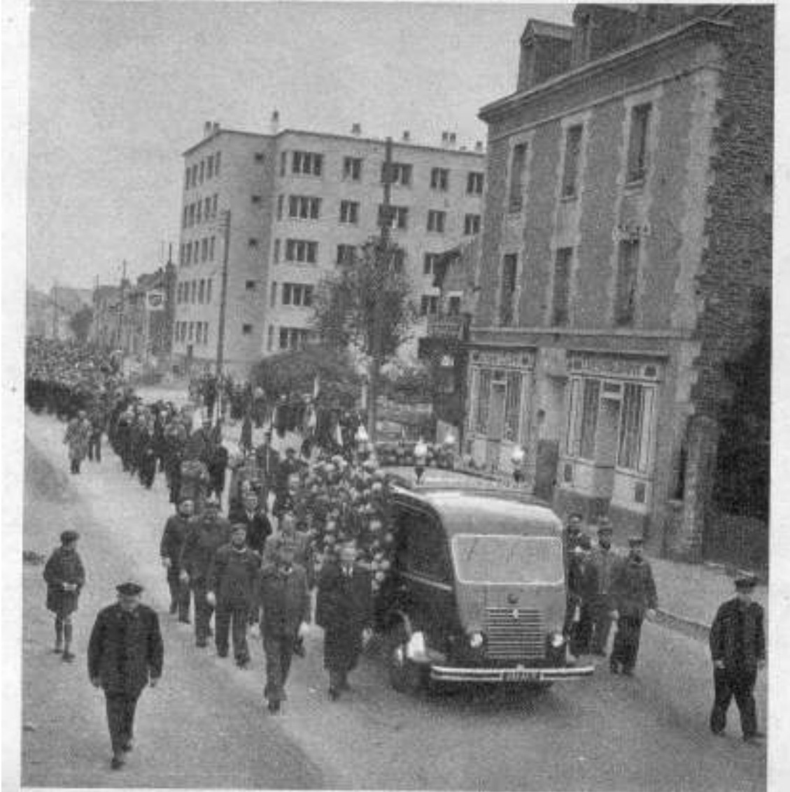
Seinem Sarg folgten 2000 Menschen sowie Eisenbahner aus fünf Ländern.

DERRIERE LE CERCUEIL, 2 000 PERSONNES ET LES CHEMINOTS DE CINQ PAYS.