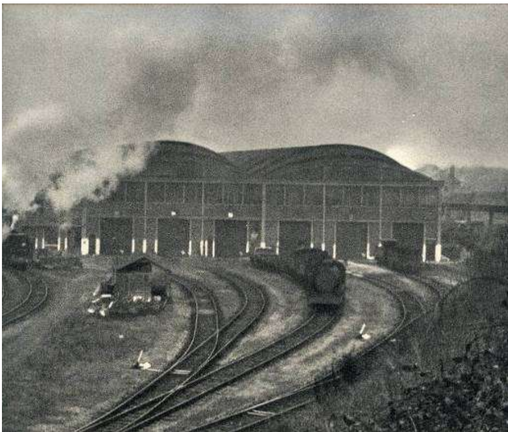
Das Depot Rennes der SNCF, Heimat der Dampflokomotiven und ihrer Personale

Im Depot Rennes stand seine eigene Pacific nach dem Unglück nicht mehr unter Dampf. In der Stunde seiner Beerdigung gaben jedoch alle betriebsbereiten Lokomotiven ein lang anhaltendes Pfeifsignal als Zeichen der Trauer und des Abschieds.